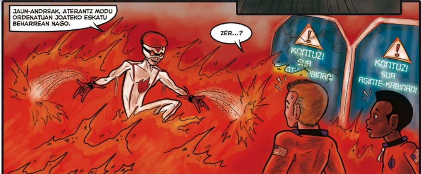
ZAILENA EZ ZEN SUAREN AURKAKO JANTZIA SORTZEA IZAN, NANOPARTIKULA-PROIEKTAGAILU HAUEK ASMATZEA BAIZIK.